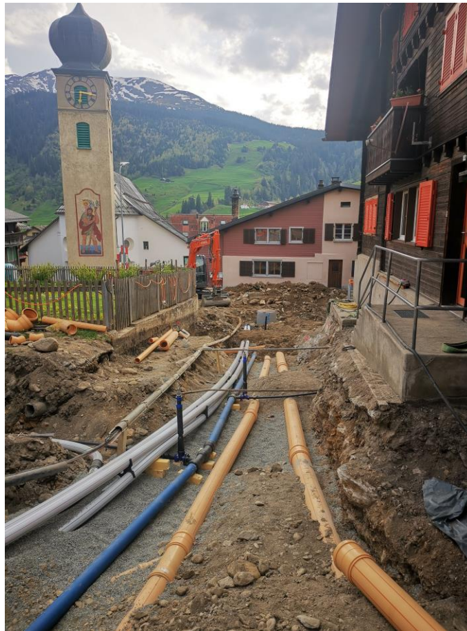
Sanaziun via Principala 2022